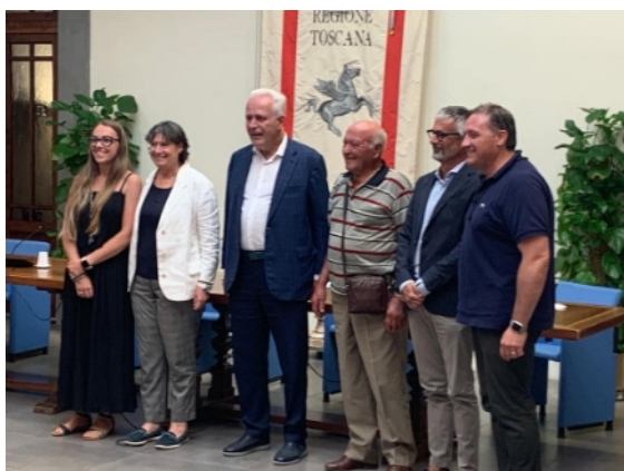
Nella foto i partecipanti alla conferenza stampa

“Il protocollo è un punto di arrivo ma anche, ce lo auguriamo, di ripartenza per la filiera del pomodoro toscano ed in particolare per la Val di Cornia, che rappresenta il 40% del prodotto toscano oggi lavorato da Italian Food – ha detto la sindaca di Campiglia - L'azienda di trasformazione del pomodoro di Venturina Terme occupa circa 400 persone, collabora con circa 400 aziende agricole, numeri importanti nella filiera, ed è per questo motivo che la nostra amministrazione comunale si è fatta promotrice di una iniziativa come questa, che ha coinvolto la Regione, Asport che è l'associazione dei produttori che maggiormente e da sempre collabora con Italian Food e Asa, per tutelare e possibilmente sviluppare questa azienda molto importante per la filiera del pomodoro, oltre che per il tessuto sociale ed economico della Val di Cornia. Come comune abbiamo cercato di mettere insieme tutti i soggetti e gli enti competenti al fine di condividere gli obiettivi di