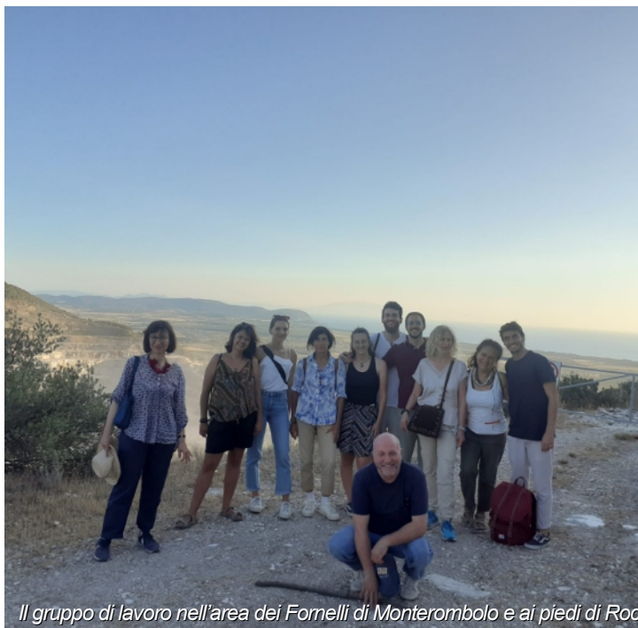
Il gruppo di lavoro nell'area dei Fornelli di Monterombolo e ai piedi di Rocca San Silvestro