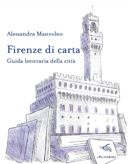
La copertina del libro di Alessandra Mastroleo

Alessandra Mastroleo (1986) – Laurea in Lingue e culture dell'Asia Orientale, vive tra la Toscana e Milano. Lavora nel mondo editoriale come redattrice e scrittrice di testi occupandosi in particolare di editoria di viaggio. Nel 2013 ha creato il sito turismoletterario.com in cui parla di luoghi della letteratura proponendo itinerari ispirati a libri e scrittori. Scrive articoli sul turismo letterario in Giappone per il sito dell'Ente del turismo giapponese Japan National Tourism Organization (JNTO).