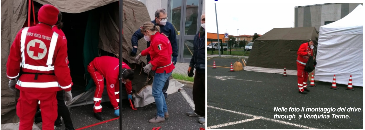
Nelle foto il montaggio del drive through a Venturina Terme.

Da lunedì 7 febbraio apre il drive through per i tamponi antigenici a Venturina Terme allestito grazie alla collaborazione tra Asl Toscana Nord Ovest e Croce Rossa. La processazione del test sarà immediata grazie ad una tenda pneumatica della Croce Rossa montata in loco dove il personale sanitario potrà eseguire le operazioni di test e la refertazione da consegnare nel giro di pochi minuti agli interessati.