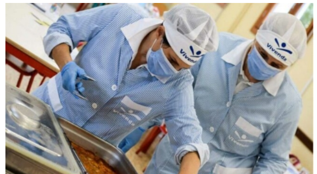
Foto: addetti al servizio mensa in una foto di repertorio