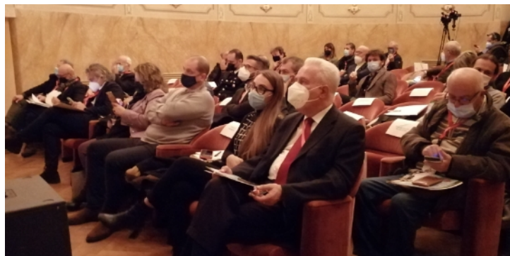
Nella foto sopra, i sindaci sul palco e, sotto, la platea con il presidente della Regione Toscana