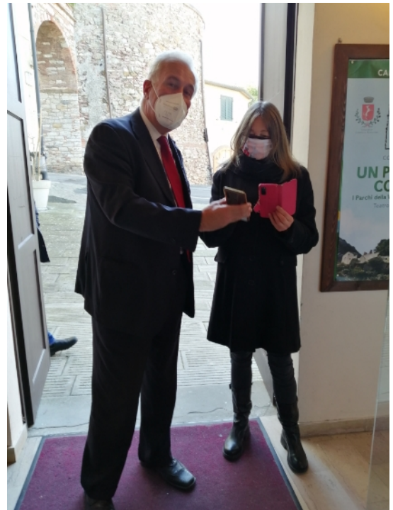
Foto sopra: il presidente Giani mostra il greenpass all’ingresso del teatro dei Concordi